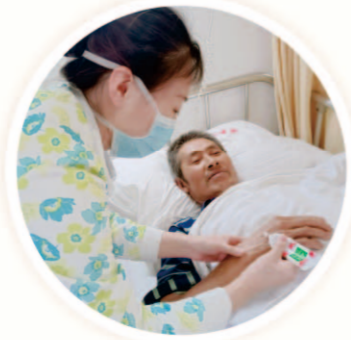
温暖冬日，“手”护患者。