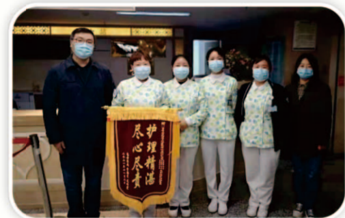
消化内科医护人员让患者在生命最后时刻依然感受到亲情般的温暖，患者家属送来一面特殊的锦旗。