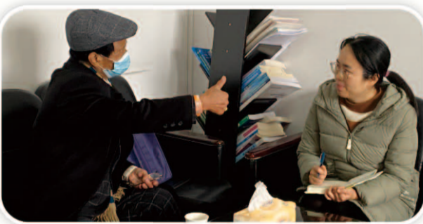
年过八旬的冯大爷来到护理部高度赞扬了心血管内科护理人员。