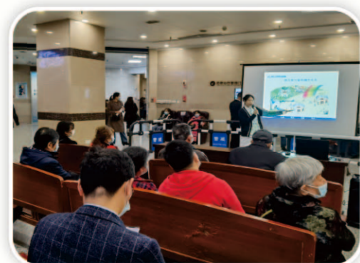
门诊健康科普讲座，传递健康养生常识。