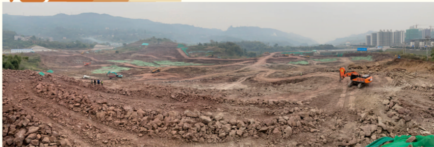
自今年5月28日正式开工以来，三峡国际健康城三峡医学中心项目一期工程土方土石方施工进度顺利，预计今年年底土石方开挖完成总量的65%。