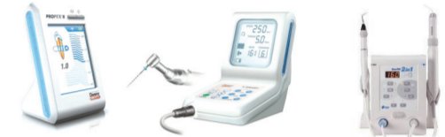
根测仪 根管马达 热牙胶充填系统